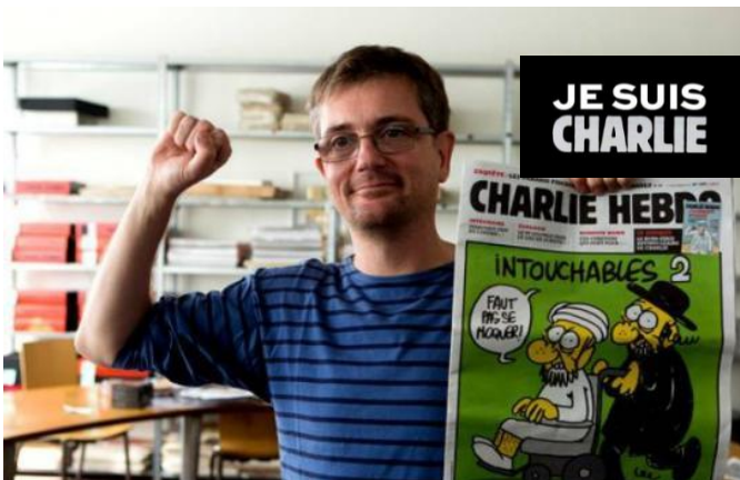
CHARB: Dessinateur et Rédacteur en Chef chez Charlie Hedbo, 1 des 17 victimes du 07/01/2015, à Paris. Ne les oublions pas...

Facebook: www.facebook.com/fonsorbeslhumaindabord